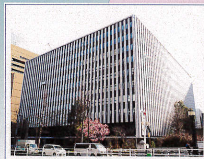
《東京国税局新庁舎》